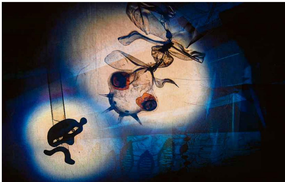
Een fietsbel (links) speelt de hoofdrol in Ring Ring .

De première plaats van Ring Ring is morgen in De Koornbeurs in Franeker. Aanvang: 20.00 uur. Kaarten zijn nog te verkrijgen via www.fjfo.nl/kaarten .